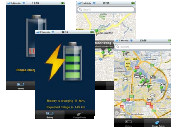
Screenshots iPhone App