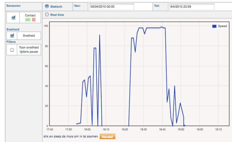
Snelheidsprofiel Tesla op 5 april